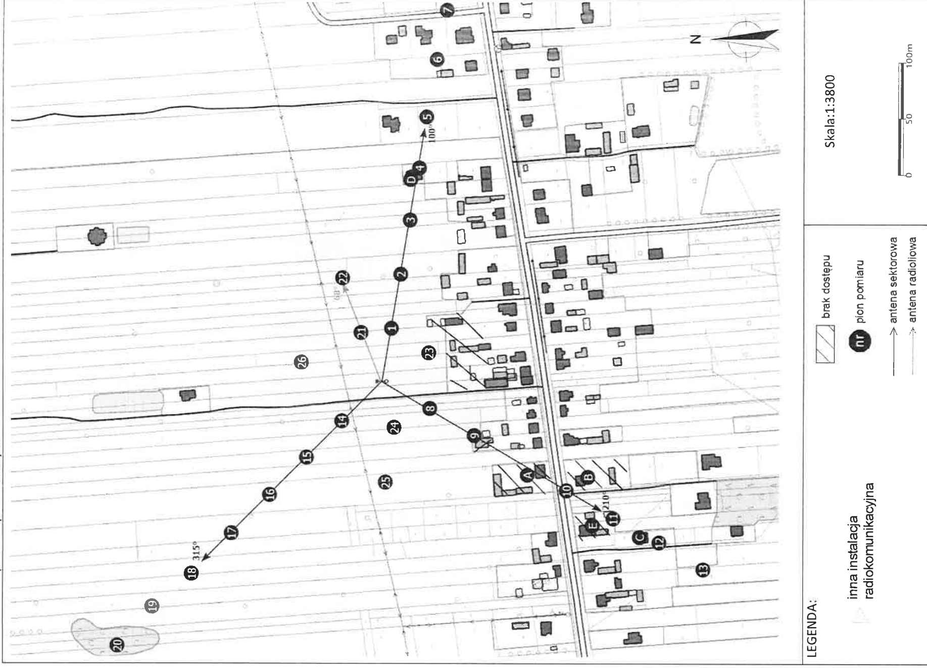
Zař. 2. Widok pionów pomiarowych

„Bez pisemnej zgody Laboratorium niniejsze sprawozdanie nie może być powielane inaczej, jak tylko w całości. Ponadto wyniki dotyczą tylko badanych obiektów przywołanych w niniejszym sprawozdaniu z badań”